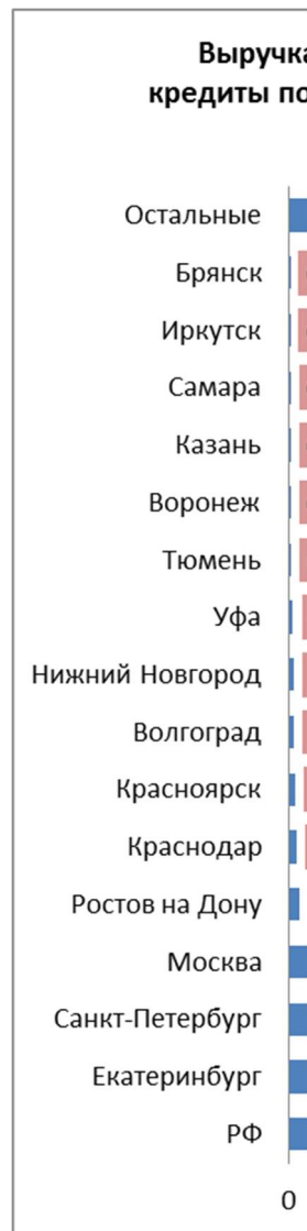
Диаграмма 1. Выручка от деятельности ломбардов предоставляющих кредиты под залог движимого имущества, млрд. руб. 2014 г. в РФ, Екатеринбурге, Санкт-Петербурге, Москве, Ростове на Дону, Краснодаре и других городах РФ