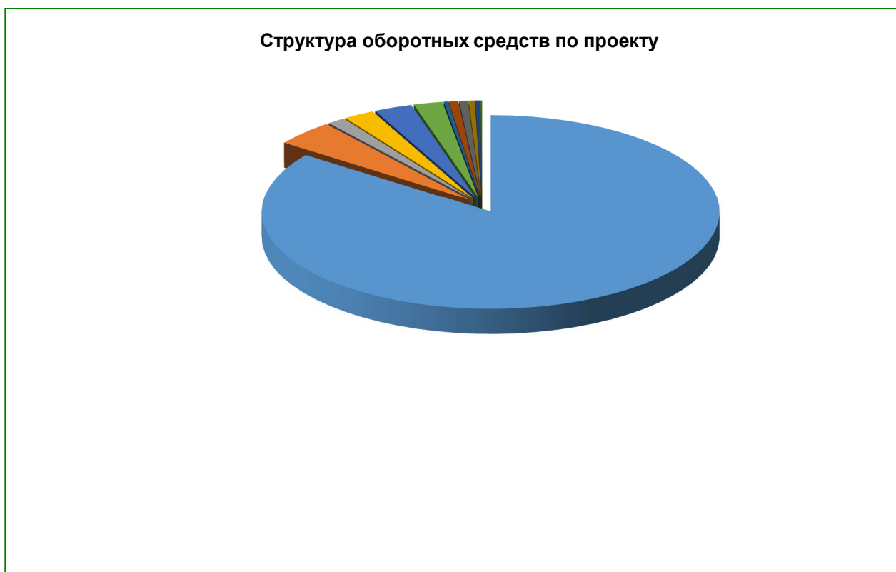
Диаграмма 6. Структура оборотных средств по проекту

В структуре оборотных средств порядка ***% приходится на предоставление кредитов под залог автомобилей и ПТС на начальном этапе, из прочих направлений значительную долю занимают расходы на постоянную заработную плату – 4%.