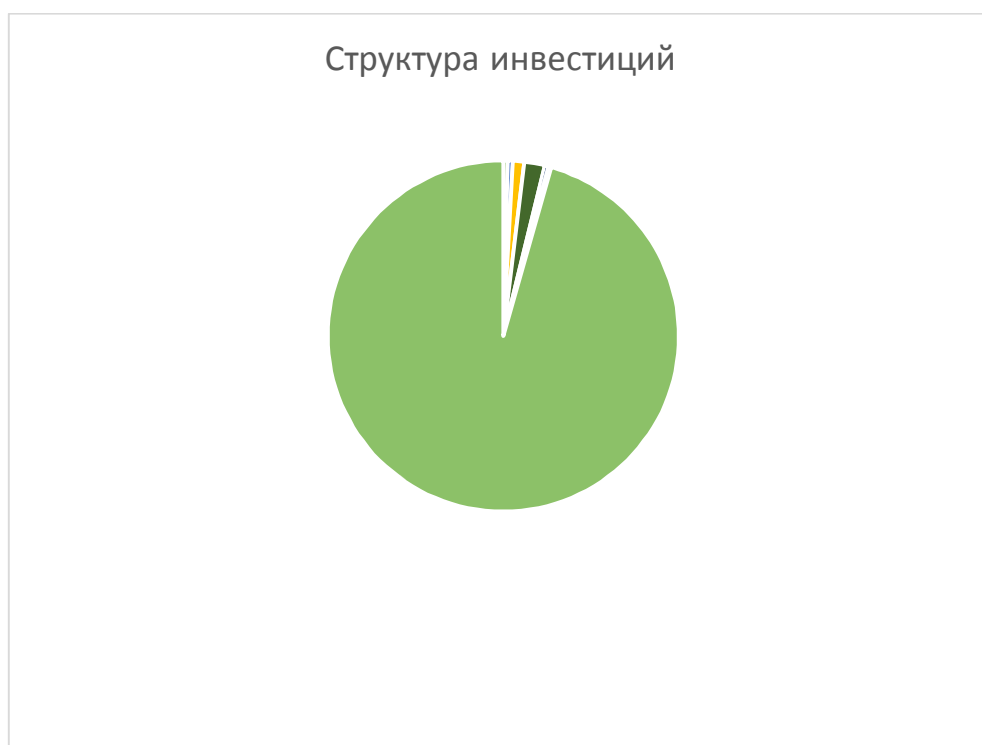
Диаграмма 4. Структура инвестиционных затрат