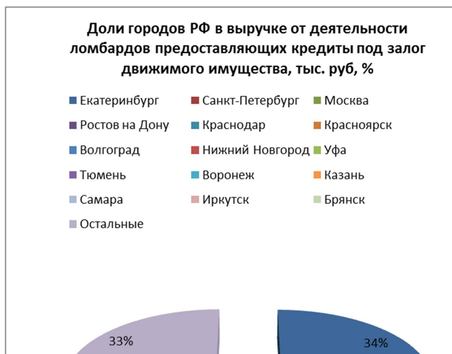
Диаграмма 3. Доли городов РФ в выручке от деятельности ломбардов предоставляющих кредиты под залог движимого имущества, млрд. руб.