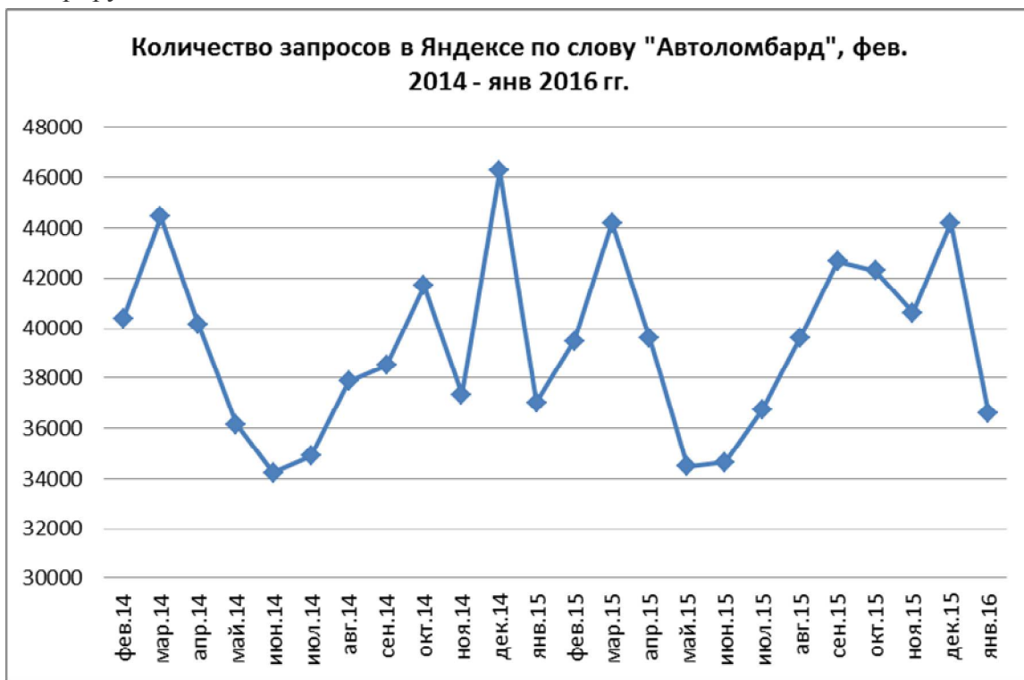
Диаграмма 4. Количество запросов в Яндексе по слову "Автоломбард", фев. 2014 - янв 2016 гг.

За последние два года количество запросов в поисковой системе Яндекс по поиску «Автоломбард» значительно увеличилось – причина тому кризис и снижение уровня жизни населения. Пики запросов приходятся на декабрь 2014, март 2015, декабрь 2015, спад регистрируется обычно в летние месяцы.