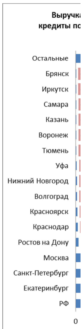
Диаграмма 1. Выручка от деятельности ломбардов предоставляющих кредиты под залог движимого имущества, млрд. руб. 2014 г. в РФ, Екатеринбурге, Санкт-Петербурге, Москве, Ростове на Дону, Краснодаре и других городах РФ