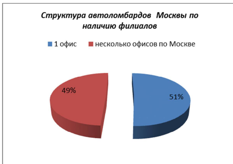
Диаграмма 6. Структура автоломбардов Москвы по наличию филиалов

51% рассмотренных ломбардов несетевые, имеют только один офис. Имеют филиалы по городу– 49%.