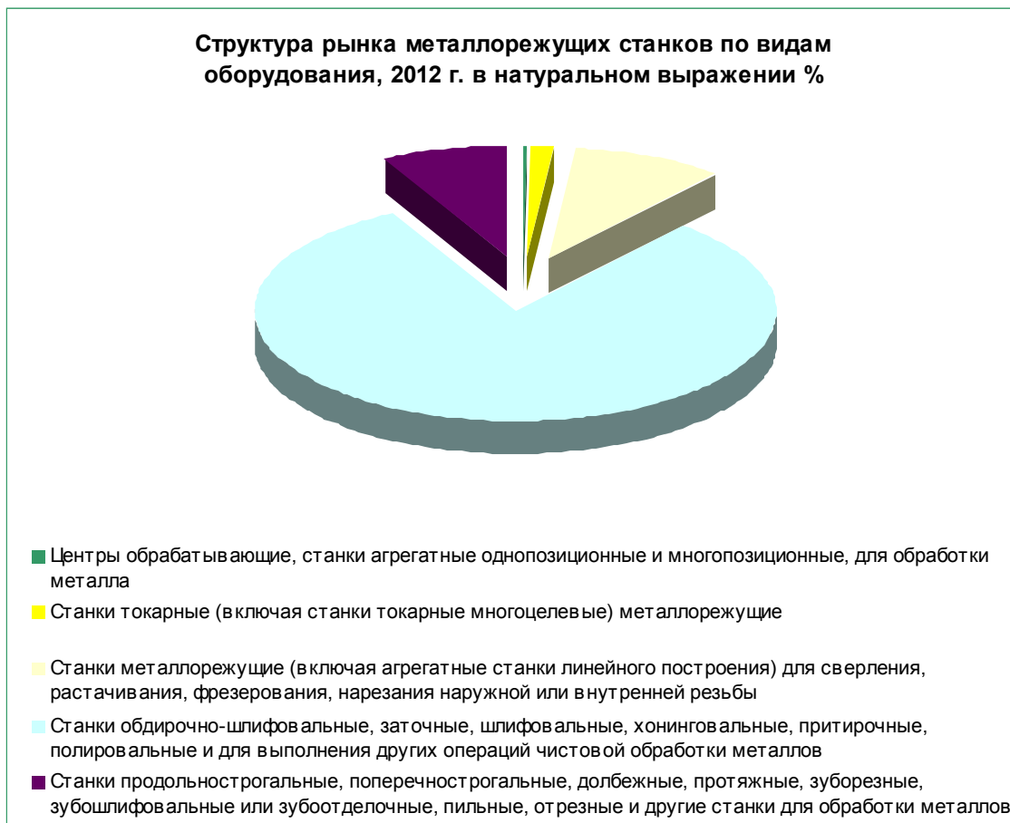
Диаграмма 2. Структура рынка металлорежущих станков по видам оборудования в натуральном выражении, 2012 г., %

Основной сегмент на рынке металлорежущих станков - станки *** металлов, в 2012 году доля сегмента составила почти ***% рынка в натуральном выражении.